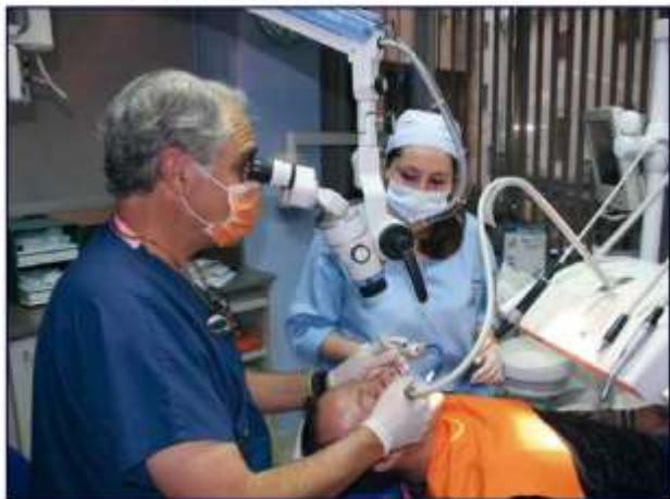
Trabajando con el microscopio en su clínica.