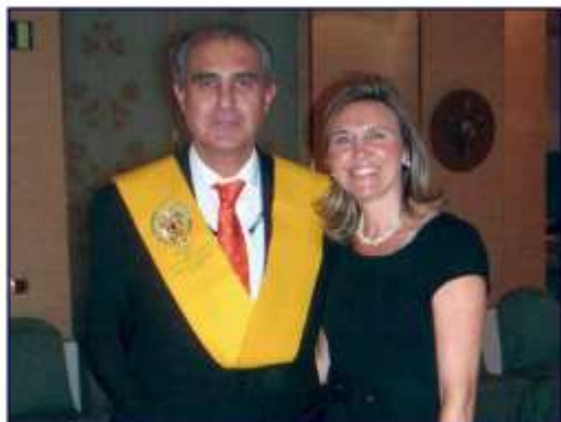
En el 25 aniversario de nuestra promoción con su mujer.