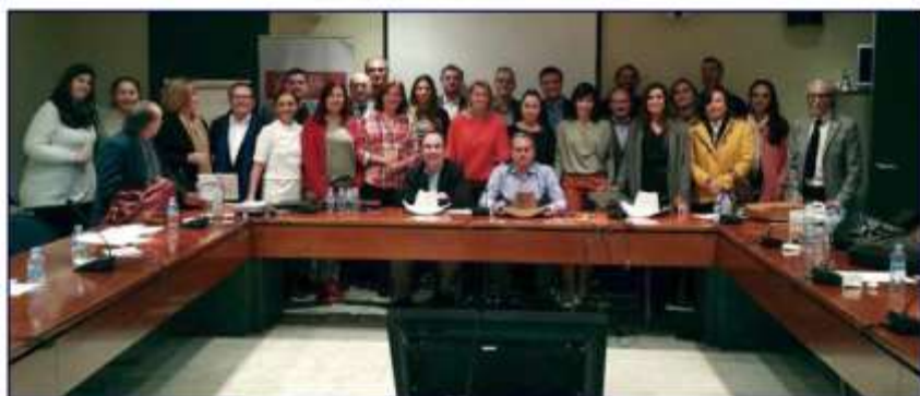
Curso de mediación en el Consejo.