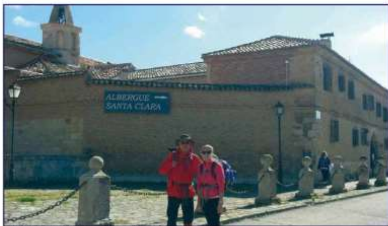
Albergue de Santa Clara, en Carrión de los Condes, con su mujer.