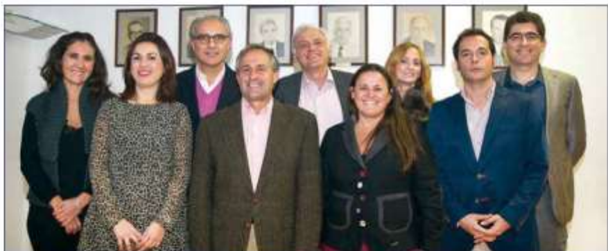
La anterior Junta de Gobierno del Colegio de Dentistas de Balears.