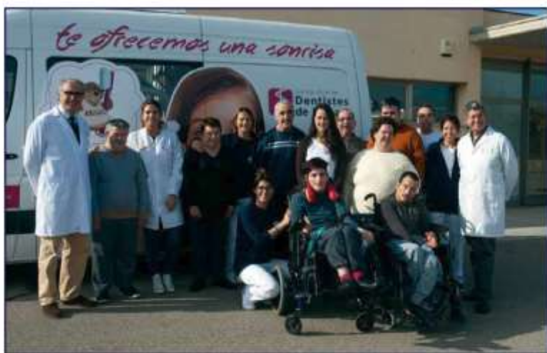
Con la unidad móvil en la residencia de discapacitados APROSCOM (Manacor).

R.- En realidad mis dos grandes pasiones son la práctica de deporte concretamente running, me encanta correr y sentir las sensaciones que me transmite el cuerpo. Haruki Murakami en su libro