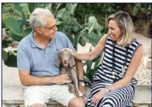
En la finca con su mujer.

R.- Como he dicho anteriormente, el ambiente hospitalario no me gusta, y si la independencia profesional que te da hacer el diagnóstico y tratamiento y