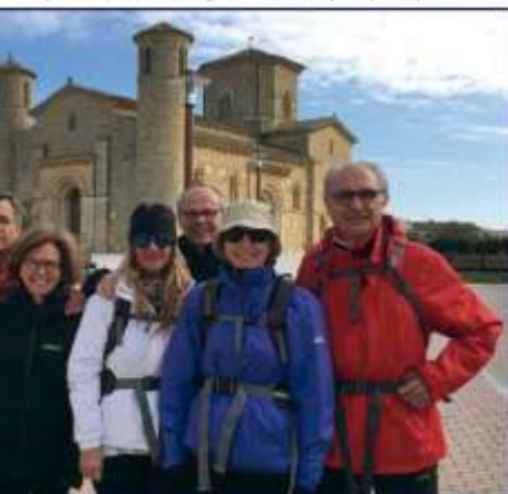
En Frómista con los amigos haciendo el Camino de Santiago, y a la derecha, saboreando los placeres de la mesa.