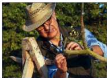
Realizando un injerto.