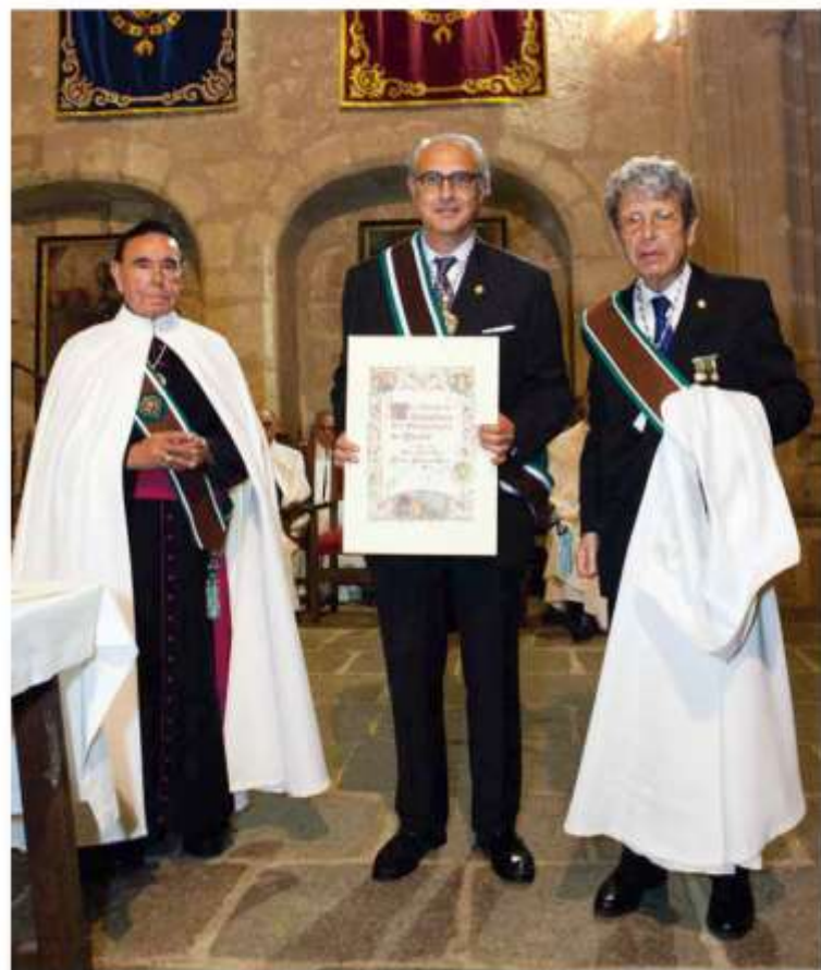
Acto de Investidura de Caballero del Monasterio de Yuste.