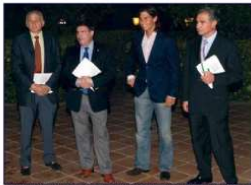
Con Rafa Nadal, antes de recibir el premio de la sonrisa del año. Con los presidentes, del Colegio de Baleares y del Consejo.